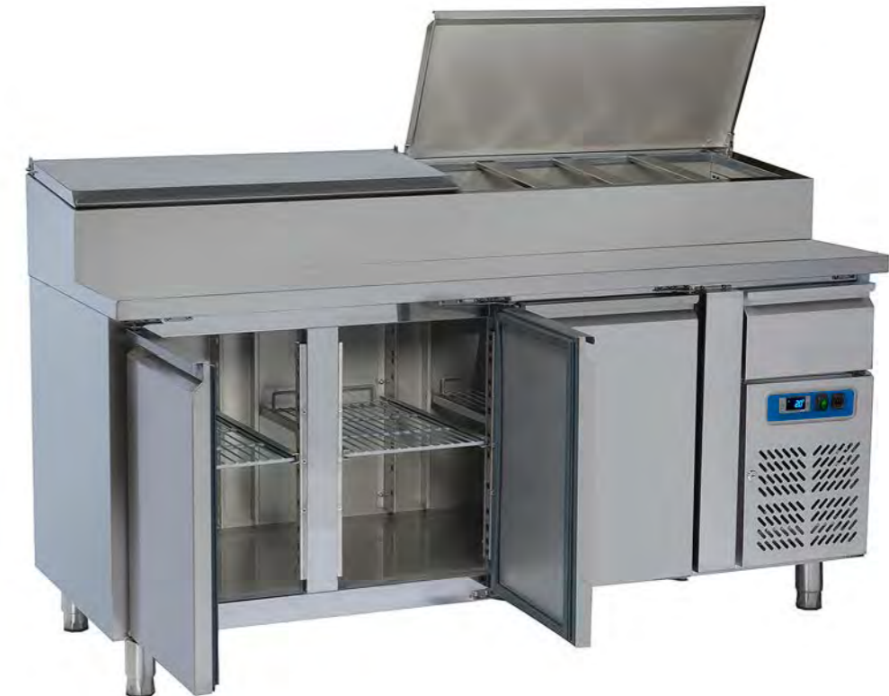
SH 3700 (3 puertas)

Distribución de cubetas modelos SH según orden de aparición. Altura máxima de cubetas 15 cm.