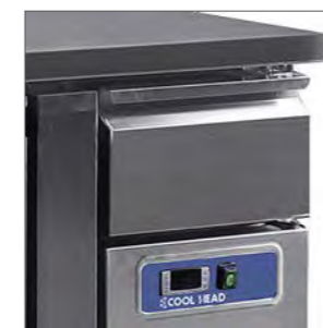
Cajón neutro en modelos conservación.