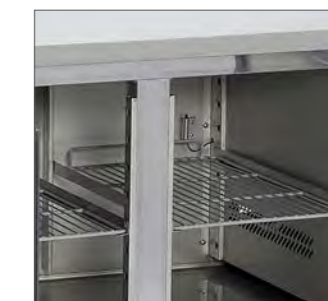
Acabados interiores redondeados para una limpieza fácil.