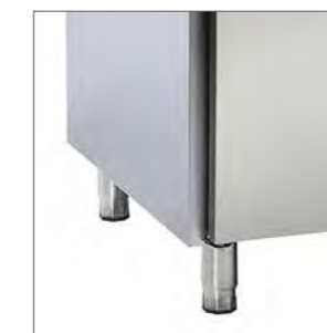
Pies regulables en altura.