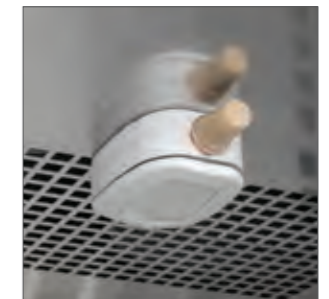
Sensor de humedad