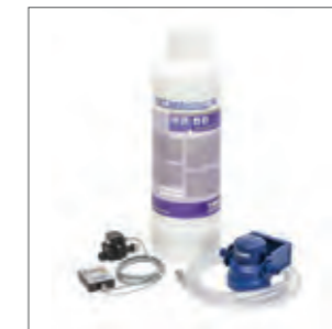
KIT de filtro de agua FDXL