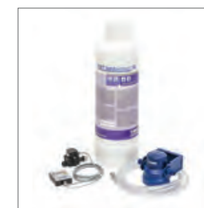
KIT de filtro de agua FDXL