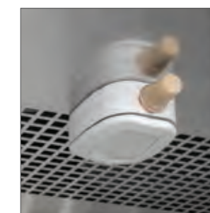
Sensor de humedad