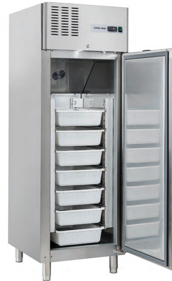
RC 610 Fish