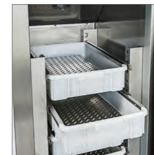
Estructura interna y externa en acero inoxidable.