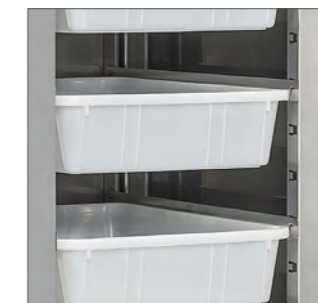
Ángulos redondeados para una limpieza más fácil.