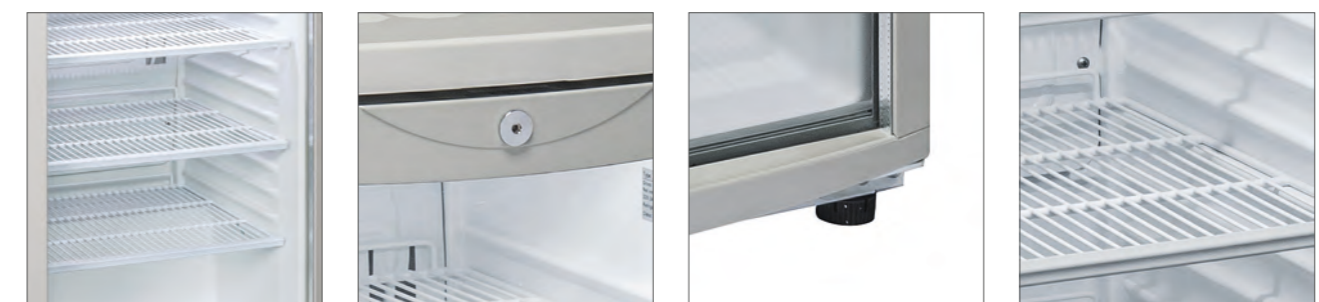
RCF 145: puede contener 139 latas de 33cl. Cerradura de serie. Patas regulables en dotación. Estantes regulables en altura.