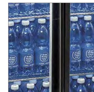
Puertas correderas modelos BBC.