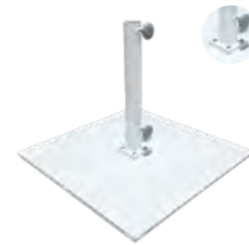
REF. MP20 / MP40