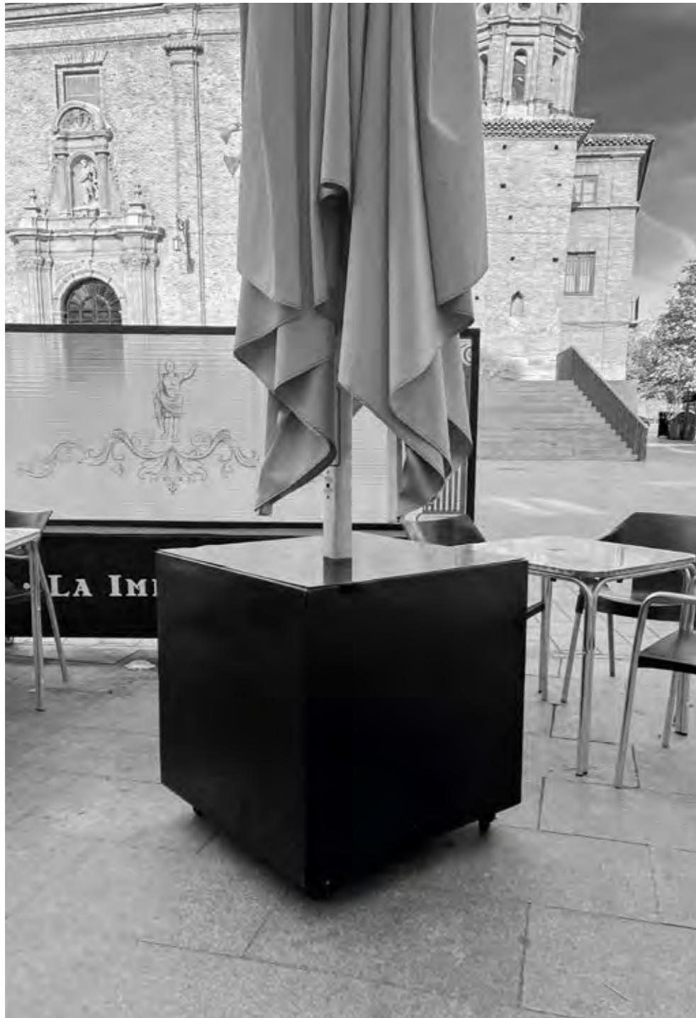
Zaragoza, España Basecajón BASEMP01M/R