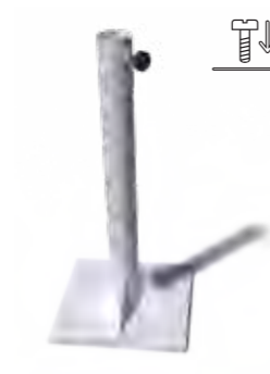
REF. 245 / 245-90