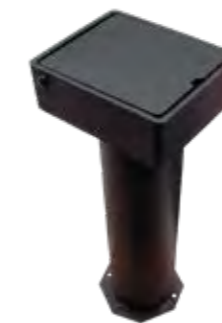
REF. 50ET / 70ET