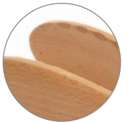
Punta ondulada Wavy tip