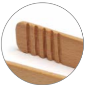
Punta estriada Ribbed tip