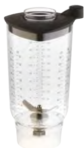
BTC.113 (0,9 l) 133 € Vaso con cuchilla para BTC.9