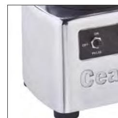
Estructura de acero. Motor alta potencia: 1300 W. (BTC.6/ BTC.10)