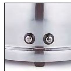
Interruptores de empuje, dos velocidades más impulso.