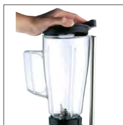
Dispositivo de desconexión automática de seguridad patentado.