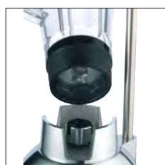
Juntas de acoplamiento de metal y goma/metal.