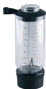
BTC.101 (0,9 l) (para BTC.1)