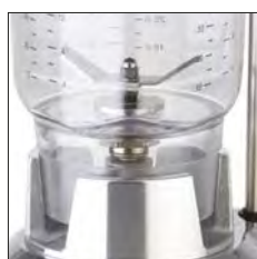
Diseño del vaso patentado. Garantiza la perfecta preparación de recetas a base de hielo y café.