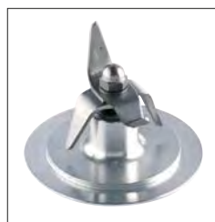
Dispositivo de bloqueo de las cuchillas completamente en acero inoxidable.