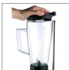
Dispositivo de desconexión automático de seguridad patentado.