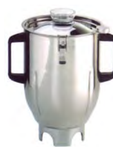
BTC.117 (4 l) (para BTC.11)