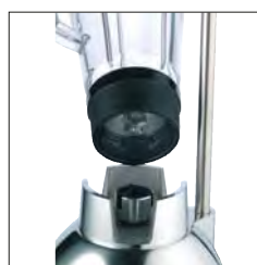
Juntas de acoplamiento de metal y goma/metal.