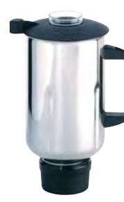
BTC.107 (2,5 l) (para BTC.7)