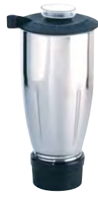
BTC.104 (1,5 l) (para BTC.4)