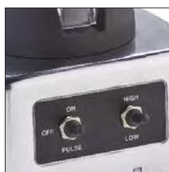
Interruptores de palanca revestidos, dos velocidades más impulso. (BTC.6)