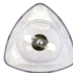
BTC.116 76 € Cuchilla para BTC.9