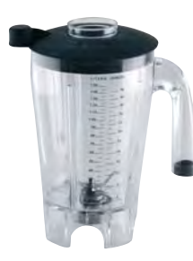
BTC.106 (1,5 l) (para BTC.6)