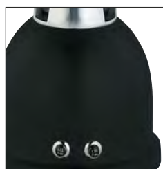
Estructura de aluminio pintado. Motor alta potencia: 900W. (BTC.8)