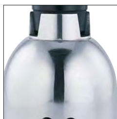
Estructura de aluminio pulido. Motor alta potencia: 900 W.