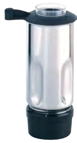
BTC.102 (0,9 l) (para BTC.2)