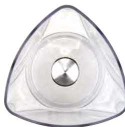
BTC.115 64 € Disco mezclador para BTC.9