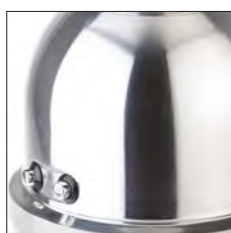
Estructura de aluminio pulido. Motor alta potencia: 900W.