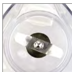
Exclusivo agitador para el hielo.