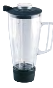
BTC.103 (1,5 l) (para BTC.3/5/8)