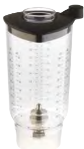
BTC.114 (0,9 l) 134 € Vaso con agitador para BTC.9