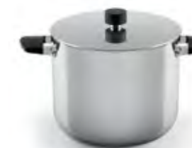
Cacerola Alta de acero inoxidable con tapadera y asas de silicona Trimetal Induction