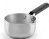
Cazo Bajo de acero inoxidable con mango de silicona Trimetal Induction