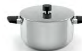
Cacerola Media de acero inoxidable con tapadera y asas de silicona Trimetal Induction