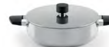
Cacerola Baja de acero inoxidable con tapadera y asas de silicona Trimetal Induction