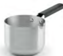
Cazo Alto de acero inoxidable con mango de silicona Trimetal Induction