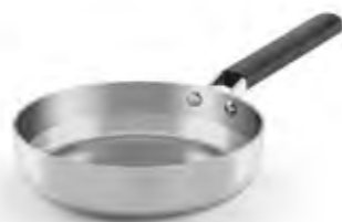
Sartén de acero inoxidable con mango de silicona Trimetal Induction