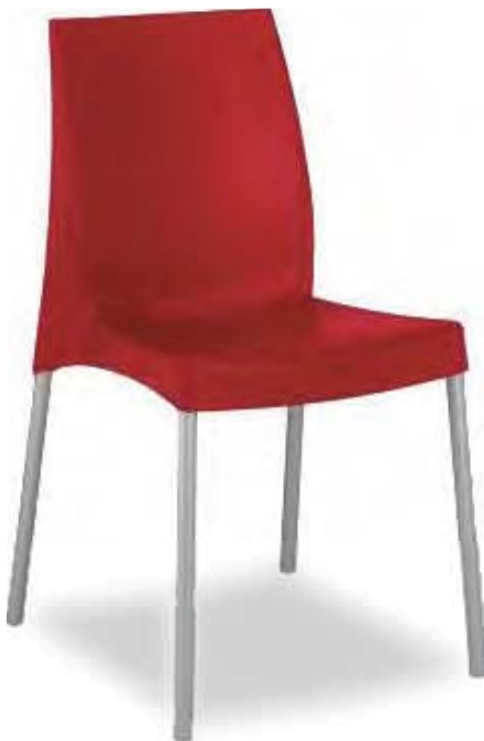
S-162 CARCASA POLIPROPILENO TUBO ALUMINIO ANODIZADO COLORES: NEGRO - ROJO - VERDE - AZUL - BLANCO