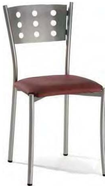
S-327 TAPIZADO SKAI O TELA TUBO ACERADO PLATA