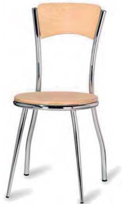
S-317 TUBO ACERADO CROMADO ASIENTO Y RESPALDO MADERA