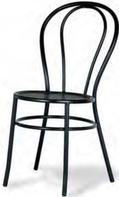
S-222 Rejilla metálica