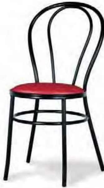
S-222 Tapizado Skai