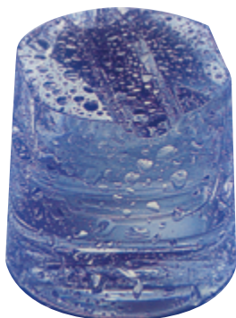
MACIZO 40 gr

ATENCIÓN DIMENSIONES: Medidas sin patas. Con patas suplementarias más de 95 mm. Observación: Producciones en condiciones óptimas; temperatura agua 15°, temperatura ambiente 20°.