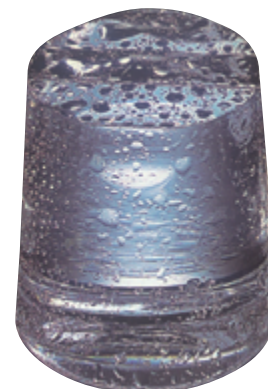
MODELO CUBITO TAMAÑO REAL 48/60 GR.