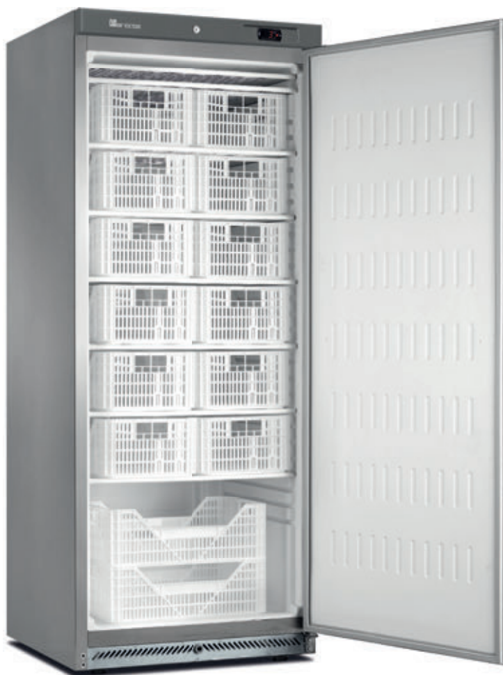
GPN-600. PS BLANCO. DIGITAL