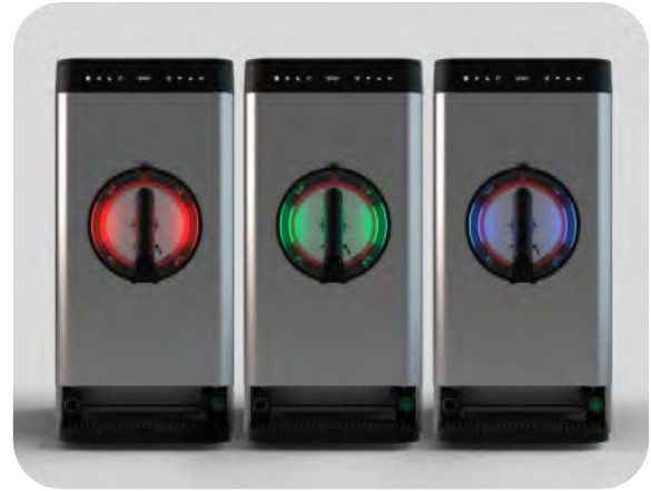
Cilindro retro-iluminado opcional