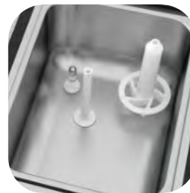
Depósito refrigerado con agitador