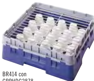
BR414 con CRPHDG2878

Mantiene en su lugar a los platos y tazas pequeños durante cada ciclo de limpieza. Utilícelo en una base Camrack de tamaño completo o en un estante plano.