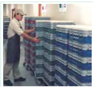
Control de inventario