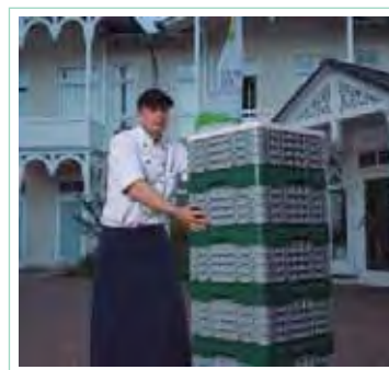
Transporte sanitario seguro

Todos los artículos resaltados en negrita son productos en stock habitual. Consultar colores disponibles.