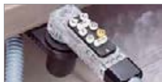
Post-Mezcla 8 Botones (BAR730 Sistema Completo)