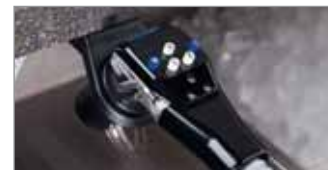
Premezcla 5 Botones (BAR650 Sistema Completo)