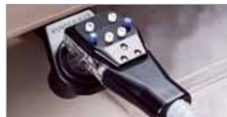
Premezcla 6 Botones (BAR730 Sistema Completo)