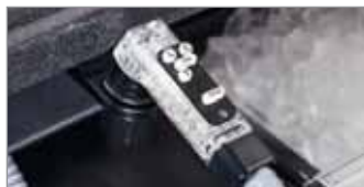
Post-Mezcla 5 Botones (BAR650 Sistema Completo)