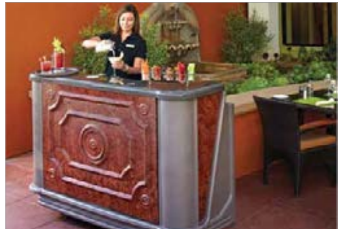
Modelo BAR650DS mostrado en Sedona Designer Décor.