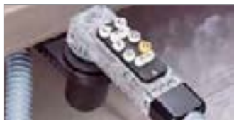
Post-Mezcla 8 Botones (BAR730 Sistema Completo)