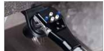
Premezcla 5 Botones (BAR650 Sistema Completo)