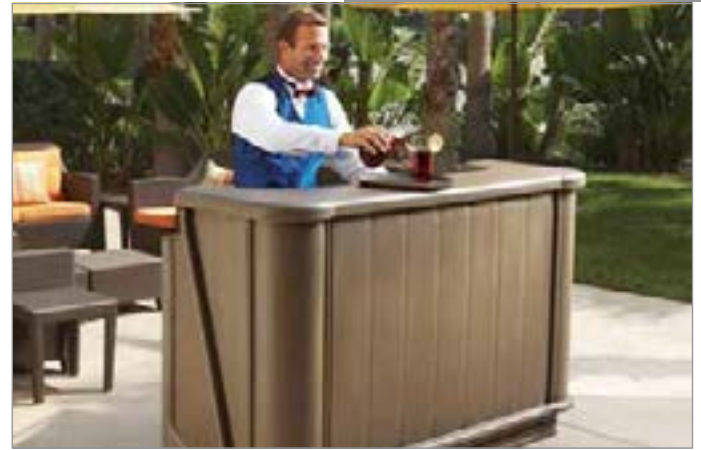
Modelo BAR650 mostrado en arena de granito Standard Décor (194).