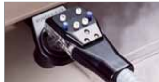
Premezcla 6 Botones (BAR730 Sistema Completo)