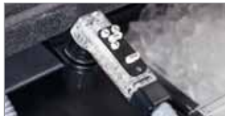
Post-Mezcla 5 Botones (BAR650 Sistema Completo)