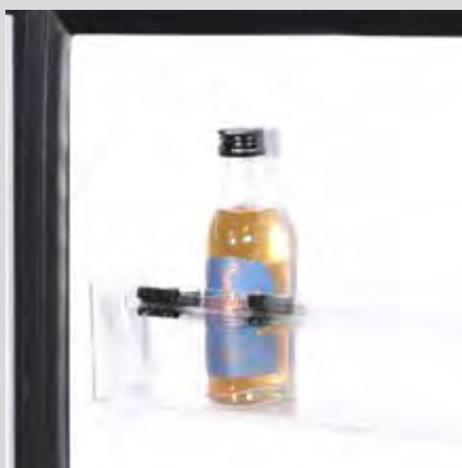
Bandejas en puerta