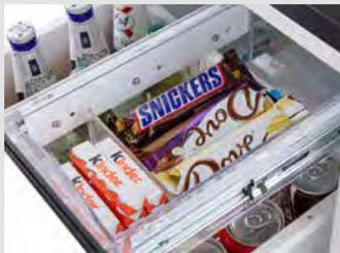
Bandeja independiente extraíble para snacks