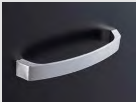
Asa central metálica satinada