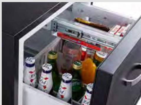
Gran capacidad de almacenamiento