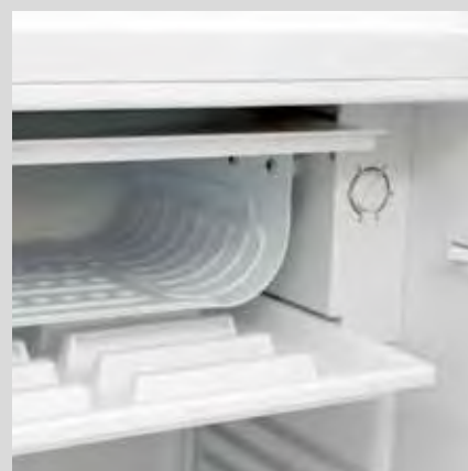
Congelador con puerta y regulador de temperatura