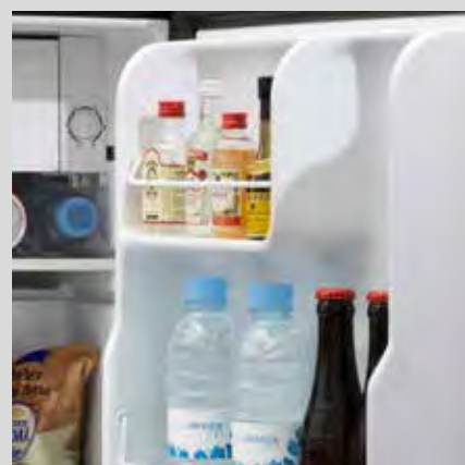
Organización de botellas en la puerta

Con gran capacidad de enfriamiento y congelador incluido.