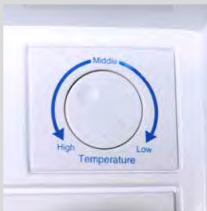
Termostato regulable en el interior