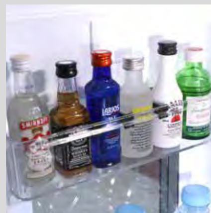
Mini botellero para almacenaje de licores