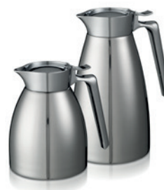
Decantadores de acero inoxidable Qline

Bravilor Bonamat suministra diversos termos que mantienen la temperatura en su punto máximo durante mucho tiempo.