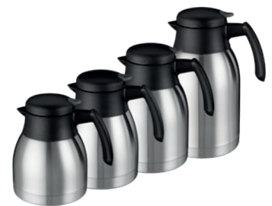
Termos de doble pared