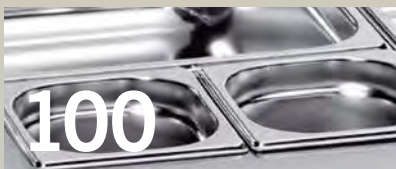
100 Bain marie