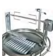
Espada giratoria Rotating sword