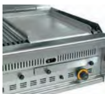
Plancha para asar / Griddle