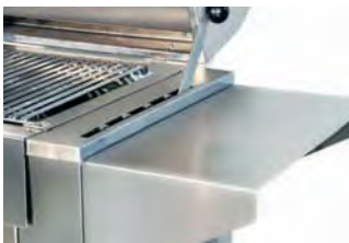
Estante Lateral Side shelf