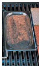
Caja de humo smoke box