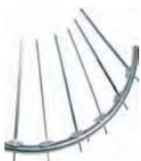
Soporte espeto Skewer support