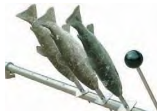
Soporte para espetos (incluye 12 espetos) Fish skewer. (It includes 12 skewers)