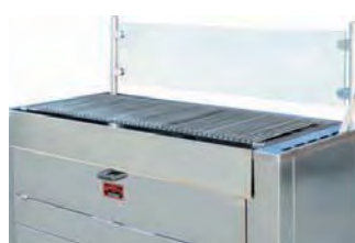
Panel de protección higiénico Hygiene shield pane