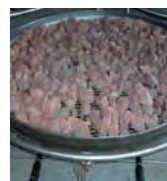
Quemador lava-gas Lava-gas burner