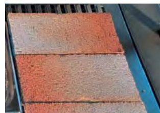
Placa refractaria Fire bricks