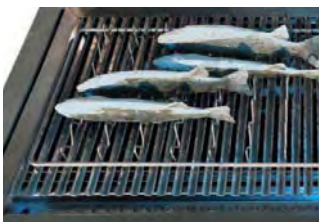
Rejilla con barra redonda Fish rack