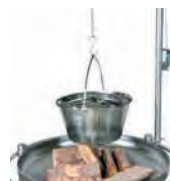
Olla con tapadera Pot with lid