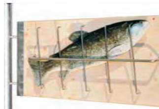
Estante para salmón Salmon rack