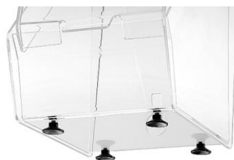
4 ventosas para la estabilidad