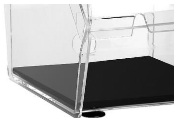
Con alfombrilla de protección acústica