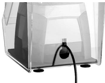
Abertura para salida de cable