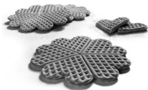
Forma de corazón