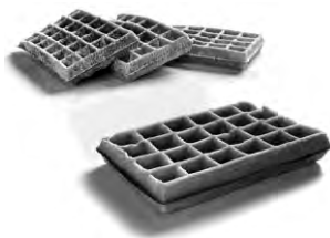
Gofre de Bruselas