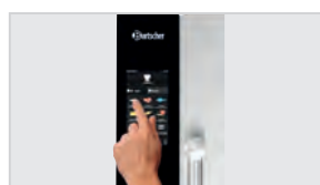
► Rack Control ► Para una selección de programa por balda