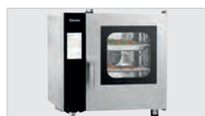
► Control electrónico con 600 programas (300 preinstalados, 300 programables)

Acero inoxidable 18/10 Sistema automático de limpieza de 3 niveles con programa de secado Generación de vapor por inyección directa Vapor Cocción Delta T Vapor y convección Cocción a baja temperatura Motor reversible (ruedas ventiladoras) Convección Enfriamiento en la fase de cocción Vaporización manual Sí Sí 300 preinstalados 300 programables 9 50 °C a 300 °C 3 niveles Frontal, abajo Frontal, abajo 3/4" Cámara de cocción redondeada Rieles de apoyo desmontables Puerta doble cristal Iluminación LED en la puerta 1 rejilla GN 1 bandeja de horno GN