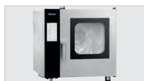
► Sistema de limpieza automático de 3 etapas con programa de secado