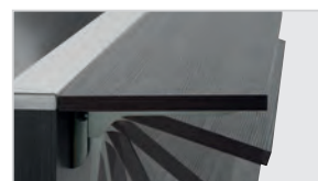
▶ Color Antracita