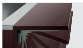
▶ Color Wengué