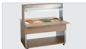
▶ 4 x 1/1 GN