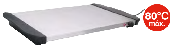
Placa calentamiento eléctrica inox

(No depositar en el cristal productos muy calientes ni muy fríos al inicio del uso)