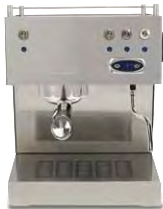
PID (external temperature control)