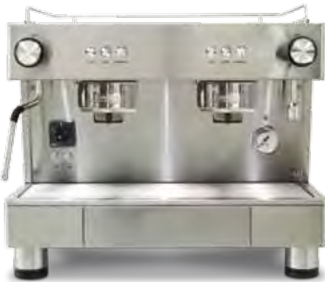
Bar Capsule Auto-ejection 2 GR COMPACT (56 cm)