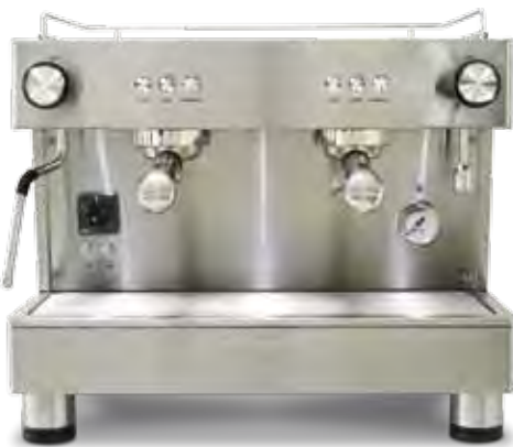
Bar Versatile 2 GR COMPACT (56 cm)