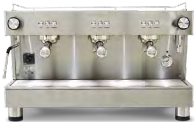
Bar Versatile 3 GR (70 cm)