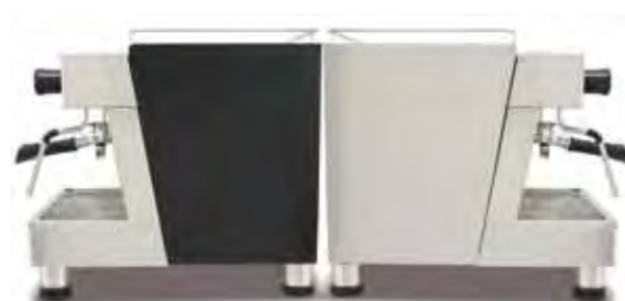
Standard Version (black-inox)