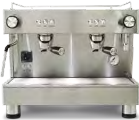
Bar Pod 2 GR COMPACT (56 cm)