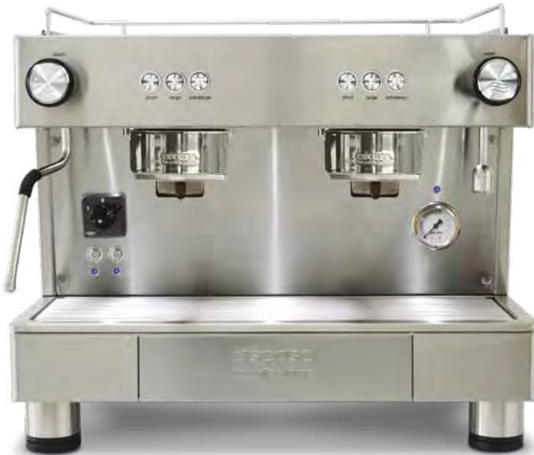
Consumo de café moderado (Caldera inox 4L y bombas vibratorias)