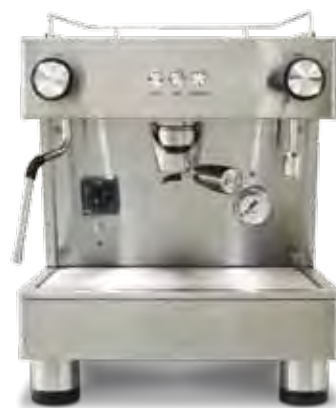
Bar Pod 1 GR (40 cm)