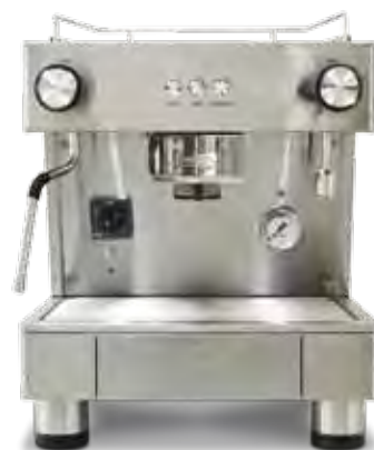
Bar Capsule Auto-ejection 1 GR (40 cm)

Cajón cápsulas desechables. 50 u. Avisador acústico.