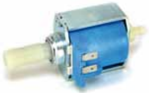
Bomba ARS café 65 W - 20 bar