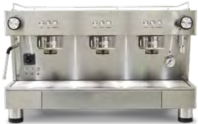
Bar Capsule Auto-ejection 3 GR (70 cm)