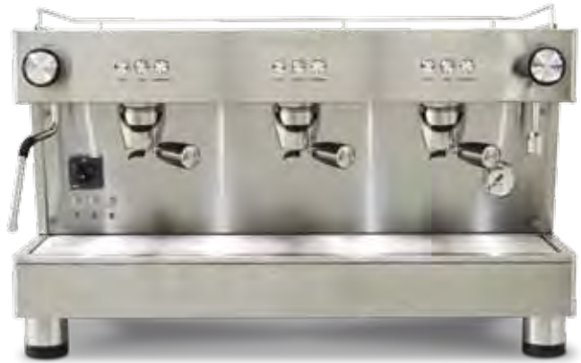
Bar Pod 3 GR (70 cm)