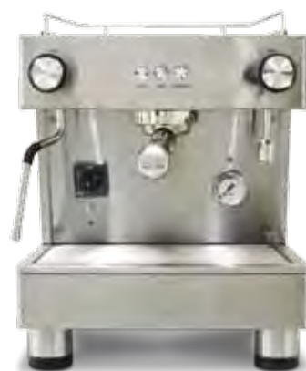
Bar Versatile 1 GR (40 cm)