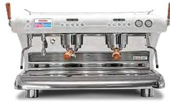
Big Dream Specialty