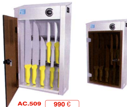
AC.509 990 €

MODELO 100 Armario con rejilla 15 cuchillos