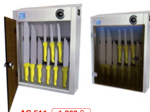
AC.511 1.260 €

MODELO 725 Armario con rejilla 22 cuchillos