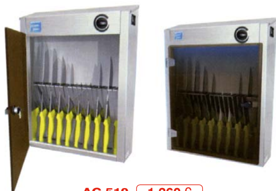
AC.510 1.260 €

MODELO 100 SM Armario con imanes 15 cuchillos