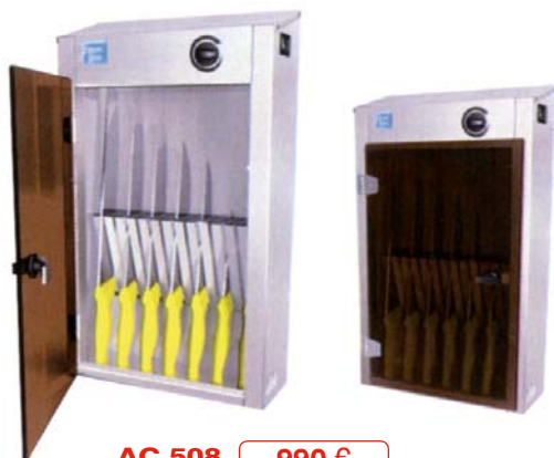
AC.508 990 €

Fabricado en acero inoxidable AISI 304 de alta calidad, puerta en metacrilato ahumado para evitar la salida al exterior de la luz ultravioleta i materiales homologados. También disponible con cierre y llave anti hurto.