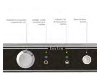
Panel de control