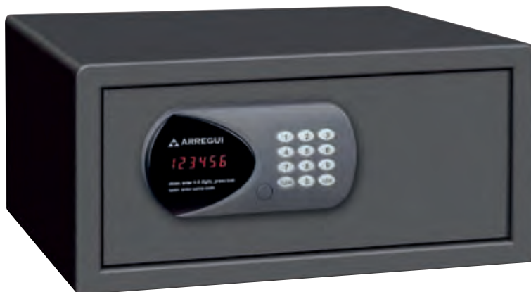
TRAVEL Ref. 51300-S3B