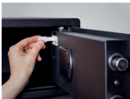
Opcional varilla magnética para activar la caja fuerte en sistemas de alquiler.