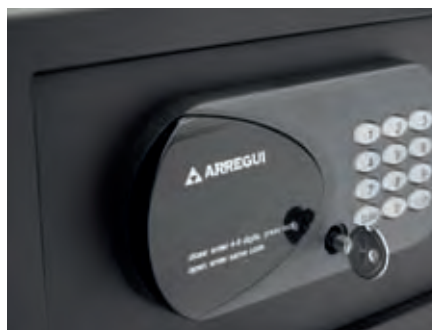
Dispone de llave de emergencia.