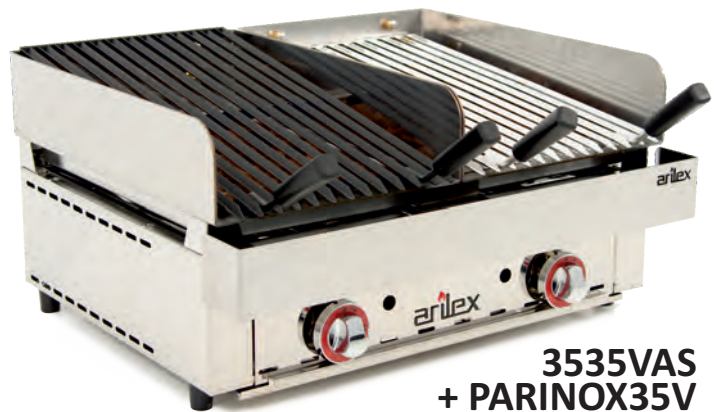
3535VAS + PARINOX35V