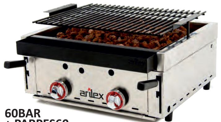
60BAR + P ARPES60