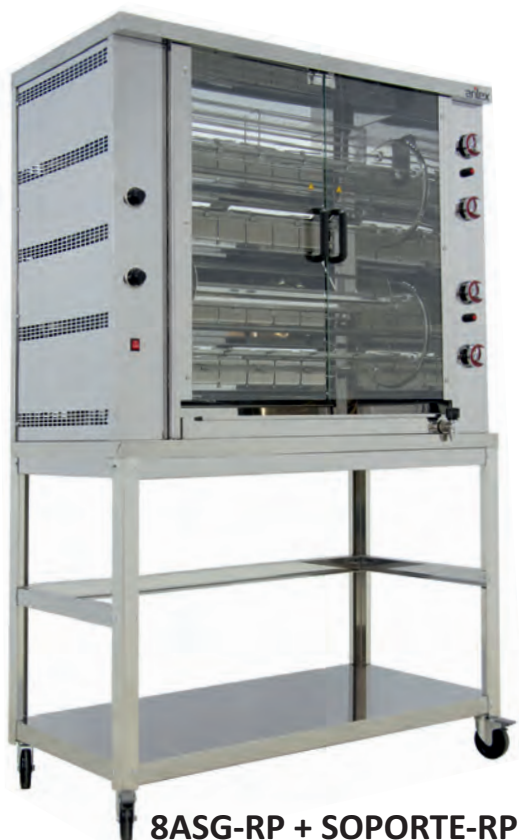
8ASG-RP + SOPORTE-RP

HAUTE PERFORMANCE COMPACT FAIBLE CONSOMMATION TRÈS POLYVALENT