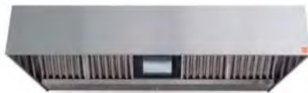
ECO R MONOBLOC