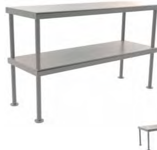
TABLE OVER SELF ETAGERE SUR TABLE PRATELEIRA SOBRE MESA