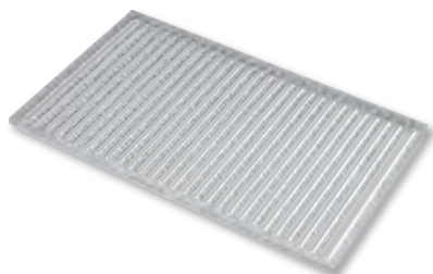
Parrilla con revestimiento antiadherente B-Cristal