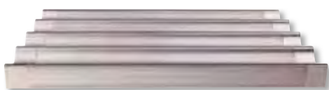
Placa para baguettes - microperforada