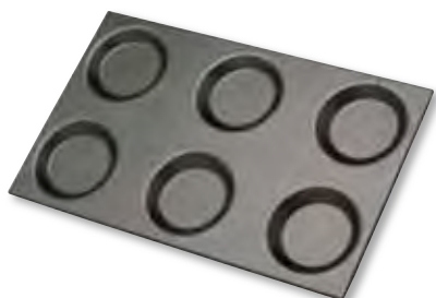
Bandeja con moldes