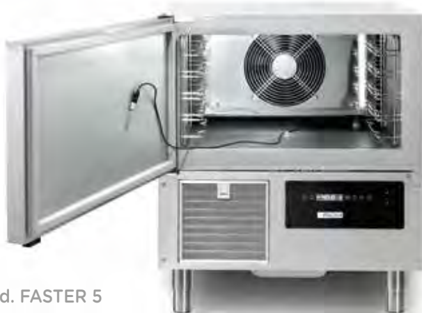
Mod. FASTER 5