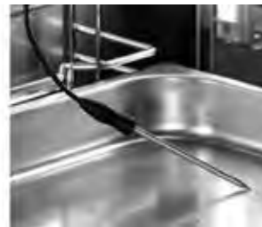
Sonda al corazón.