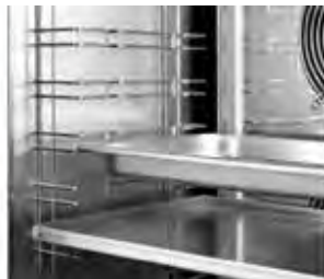
Guías para bandejas GN1/1 y 400x600mm.