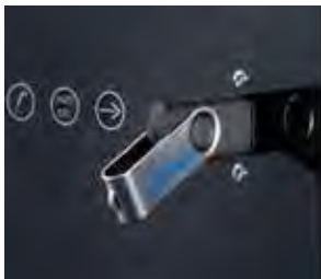
Registro de datos HACCP, puerto USB para descargar los datos.