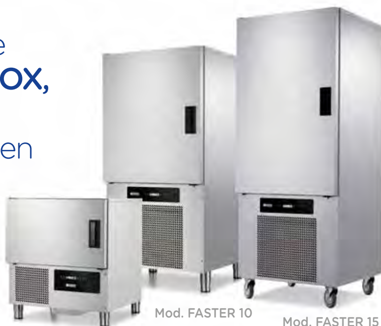
Mod. FASTER 5

La nueva línea de abatidores AFINOX , competitivos en el precio y fiable en las prestaciones.