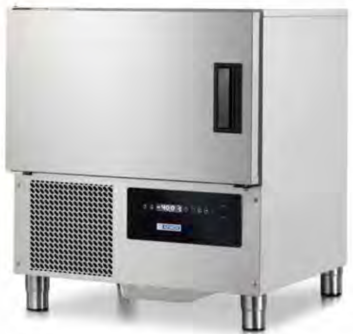
Mod. FASTER 5