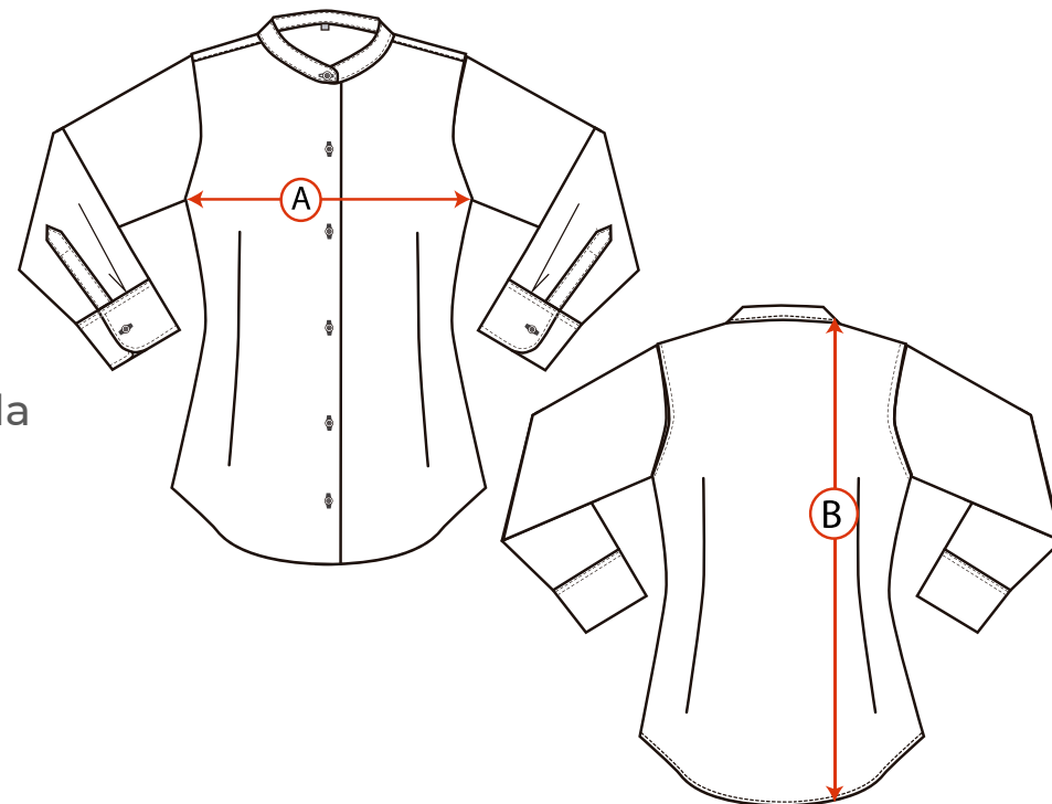
Tabla de medidas