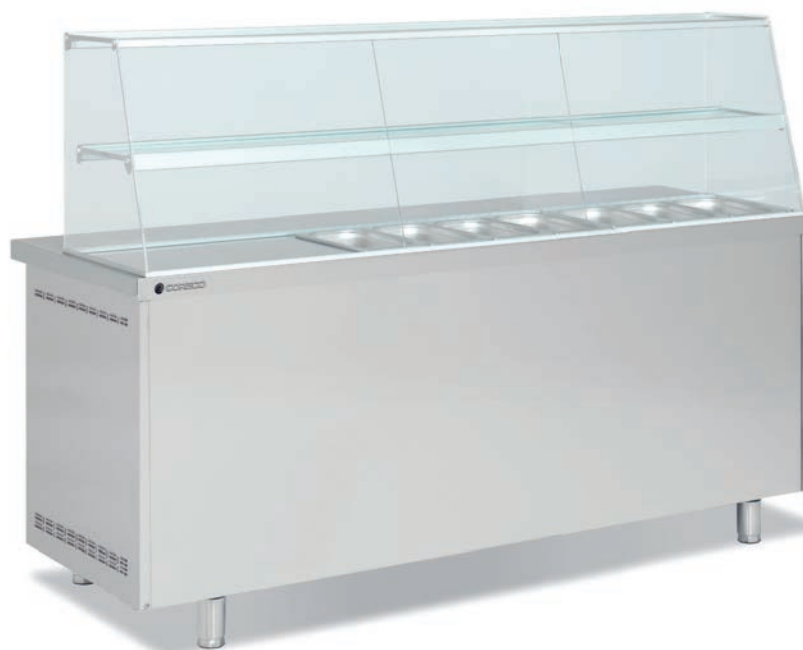
MFK70-180 Vista trasera Back side view