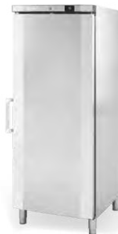
AC 600 BT