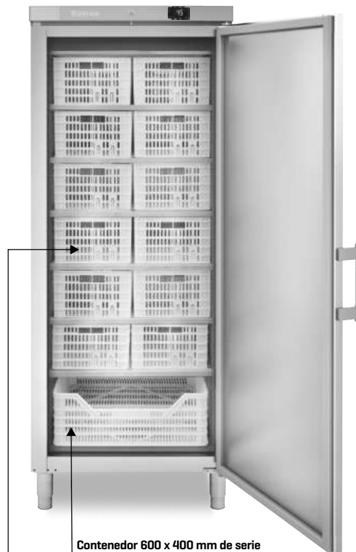
AC 600 BT

Contenedor 600 x 400 mm de serie Container 600 x 400 mm standard Container 600 x 400 mm de série