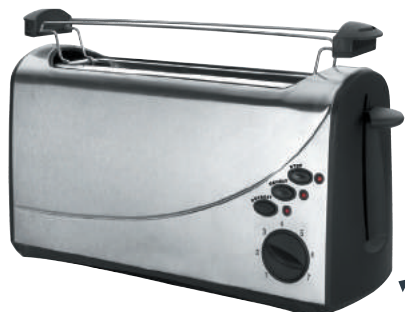
Bandeja recogemigas Plateau ramasse-miettes Krümelbehälter Crumb tray Bandeja recolhe-migalhas

Opción de descongelar pan. Parrilla adicional para calentar bollos o pan Option de décongélation du pain. Grille supplémentaire pour réchauffer des viennoiseries ou du pain Brotauftau-Option. Additional grill for heating rolls or bread Bread defrost option. Additional grill for heating rolls or bread Opção para descongelar pão. Grelha adicional para aquecer bolos ou pão