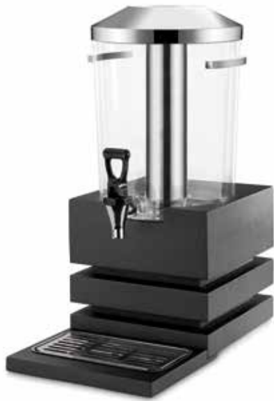
P904.800 Dispensador zumos 6 lts.