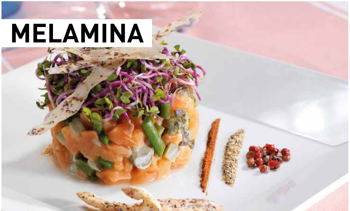
PUJADAS Ver en p. 294