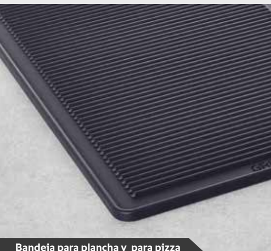
Bandeja para plancha y para pizza

Además de la tecnología de condensación del UltraVent, el UltraVent Plus está equipado con una técnica de filtrado especial. Así se evitan los vapores y humos que se generan al cocinar a la plancha y freír. Esto permite instalar los aparatos RATIONAL también en lugares de cocción frente al cliente.