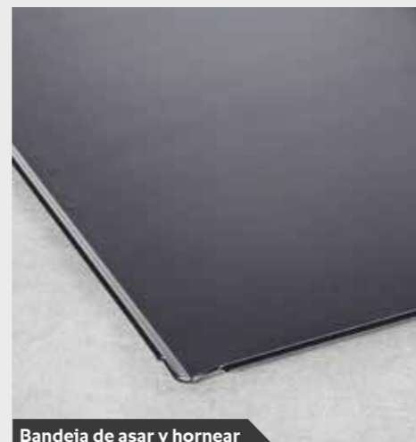
Bandeja de asar y hornear