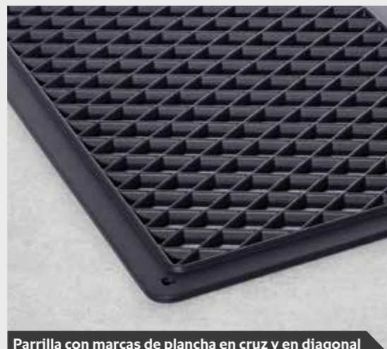
Parrilla con marcas de plancha en cruz y en diagonal