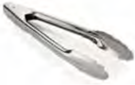
74 Pinza de acero inoxidable 24 cm - acero INOX. 0,7 mm 🍽️ 12