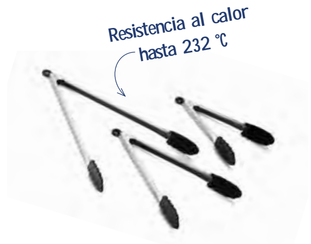
4016BK Pinza de acero inoxidable y punta de silicona 41,5 cm - acero INOX. 0,8 mm 🍽️ 12 ● INOX.

Todos los artículos resaltados en negrita son productos en stock habitual. Consultar colores disponibles.