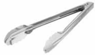
2716 Pinza de acero inoxidable 40,5 cm - acero INOX. 1,2 mm 🍽️ 12