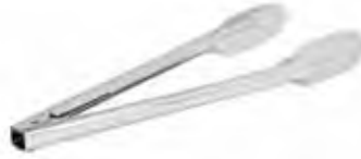
2712 Pinza de acero inoxidable 30,5 cm - acero INOX. 1,2 mm 🍽️ 12