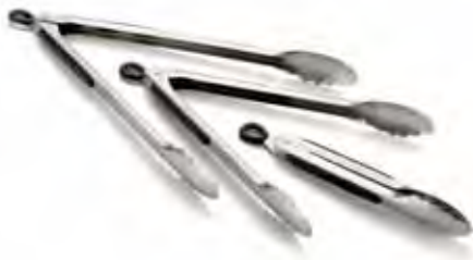
2009 Pinza ergonómica de acero inoxidable 23 cm - acero INOX. 0,8 mm 🍽️ 12 6,26 € ● INOX.