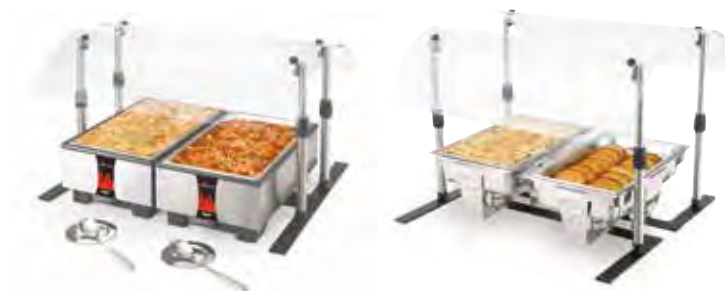
Calentadores de alimentos y retermalizadores Cayenne®

Alturas ajustables de 36,2cm a 64,1cm. Aptos para la mayoría de artículos encastrables, chafers y calentadores. Resistente base de acero con revestimiento pulvimetálico. Cristal acrílico curvado duradero. De fácil montaje. Se envían desmontadas.