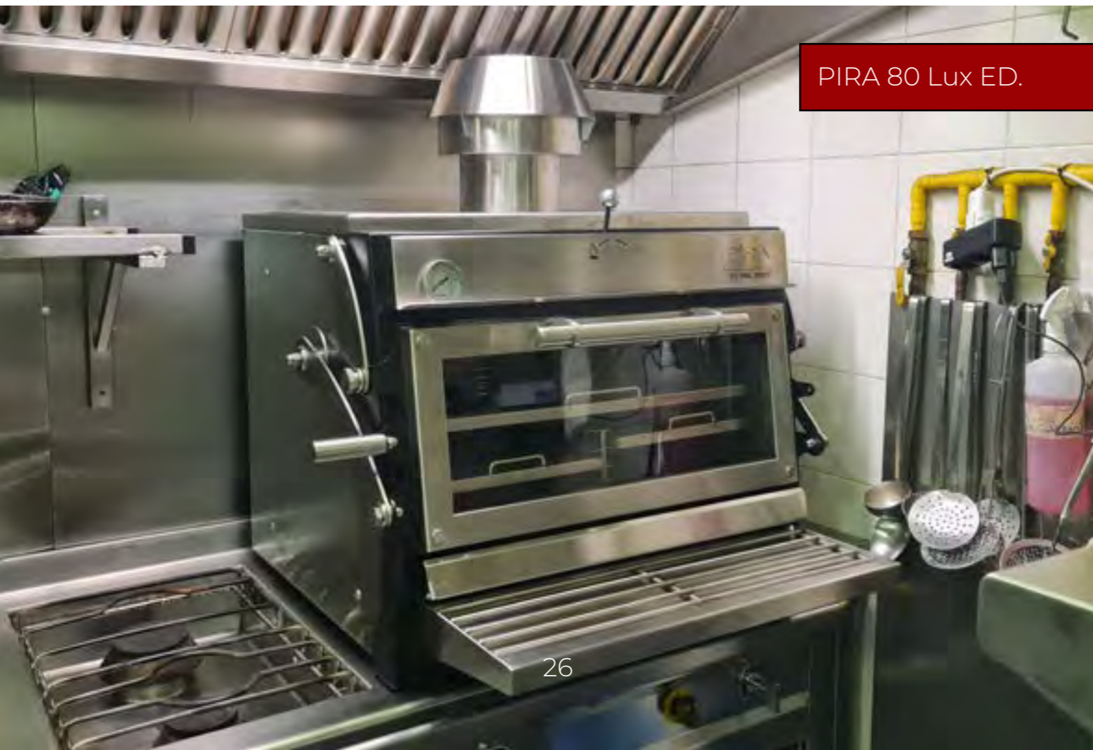
PIRA 80 Lux ED.

#noacceptesimitaciones , tu negocio te lo agradecerá.